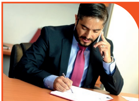
Gestione del contenzioso

Le soluzioni “flessibili” che concorrono a determinare una sostanziale e quantificabile sinergia nei processi di lavorazione, sono: