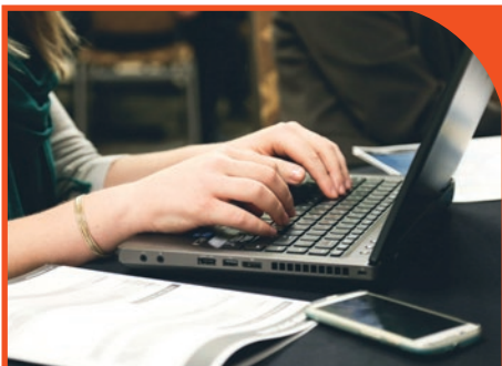
Collegamento informatico dedicato