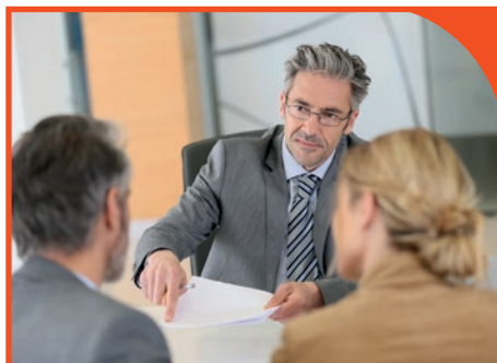
Assistenza in fase legale