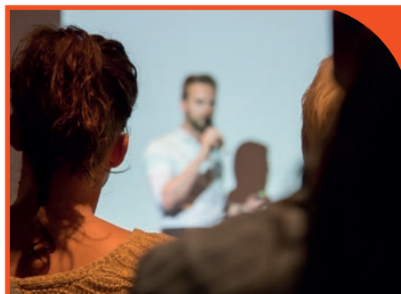
Formazione continua del personale