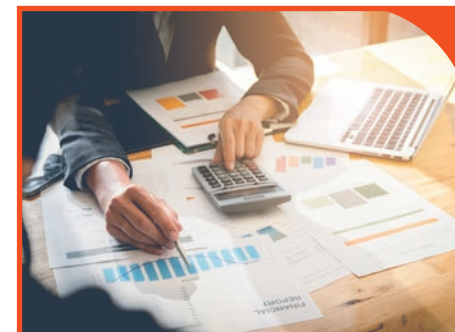
Consulenza fiscale tributaria e sul merito di credito